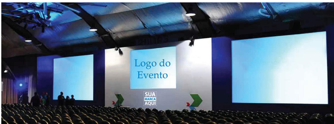
Fundo de Palco